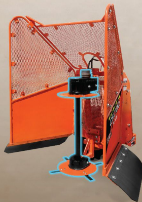
ไม่บกร่อง